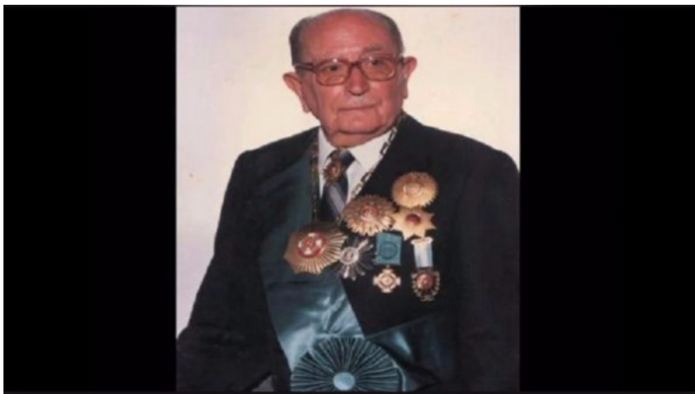
Historiador tacneño nació un 12 de septiembre de 1916